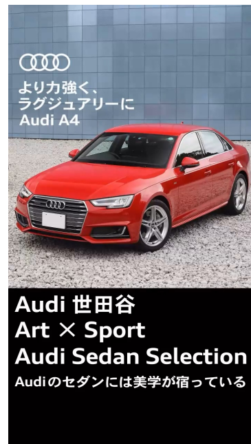
Audi A4 動画広告のキービジュアル（世田谷店用）

このエリアや興味関心を軸にしたターゲティングの結果、どこにターゲットが反応しているのか細かく分析することができ、次回マーケティング施策における重要なインサイトを発見することができました。